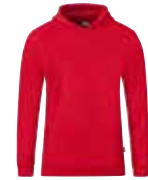
Kindergrößen ohne Kordeln