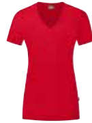
Damengrößen mit V-Ausschnitt